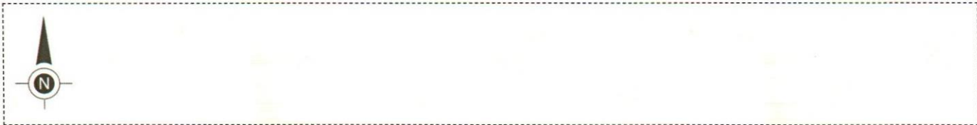
Wydruk mapy z systemu GISON skala 1:1000

(aby dodać, przeciągnij na obrazek, aby usunąć, przeciągnij z powrotem na pasek narzędzi)